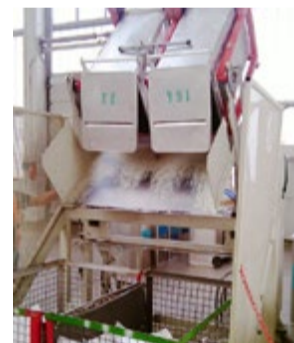
Leerung der Tonnen mit einer Hub-Kippvorrichtung