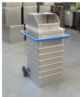
Behälter in verstärkter Ausführung mit Heberahmen und Aufsatz für Aktenordner