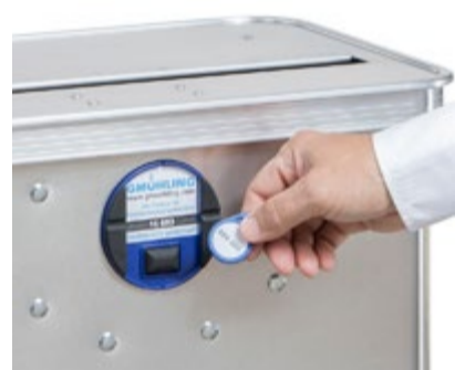
Das digitale Schloss erfüllt Anforderungen der Sicherheitsklasse 3