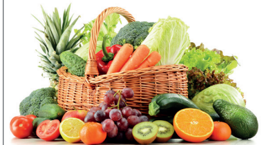
Hygienisch und geruchsneutral