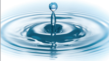
Witterungs- und Korrosionsbeständig