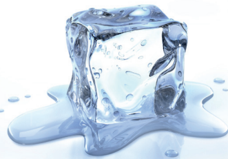
Unempfindlich gegen Temperaturschwankungen