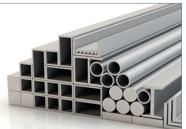
Der ideale Werkstoff, vielseitig einsetzbar