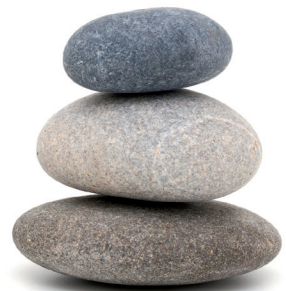
Stabil, langlebig und formbeständig