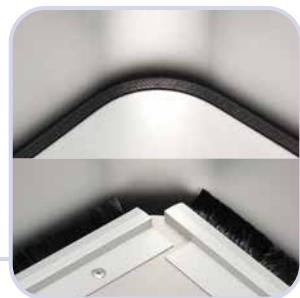
Engeres Spaltmaß mit Auflageplatte oder Bürstenleiste