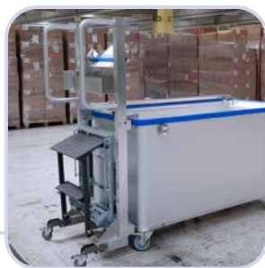
Leiter, Schiebehilfe, Getränke-, Scannerhalter, Etikettenabroller, Schreibtafel oder Klemmbrett