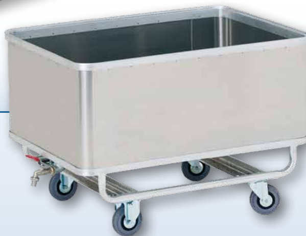
Transportwagen wasserdicht mit Ablaufhahn