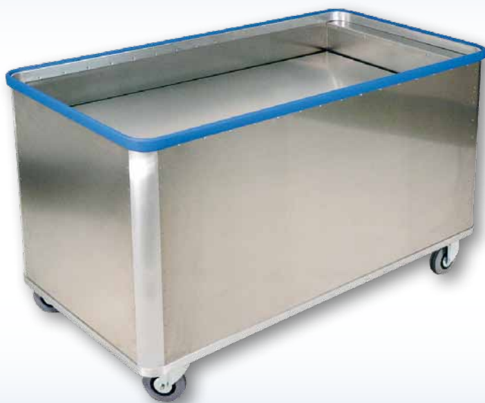
Modell D 5408 / 580