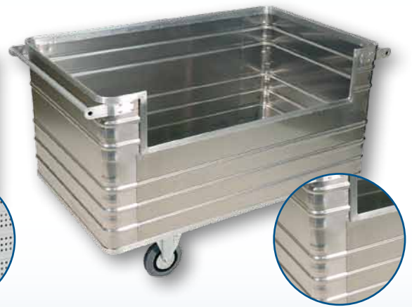
Modell D 3808 / 945