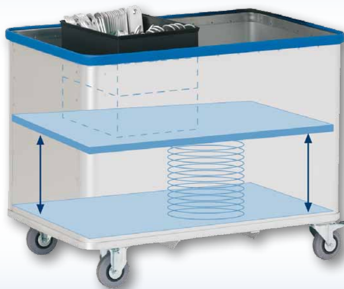
Modell D 1408 / 350 - eloxiert

Der lastabhängig, fliegend aufgehängte Boden wird in Spezialprofilen einer Wagen-Stirnseite verkantungsfrei geführt. 8 kugelgelagerte Rollen sorgen für eine präzise Parallelbewegung des Federbodens. Glatte Wände reduzieren die Reibung des Ladegutes und begünstigen die sofortige Reaktion des Federbodens auf Gewichtsveränderung.