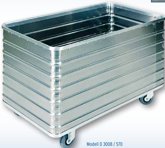
Modell D 3008 / 570