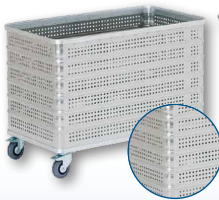
Modell D 3008 / 430 P