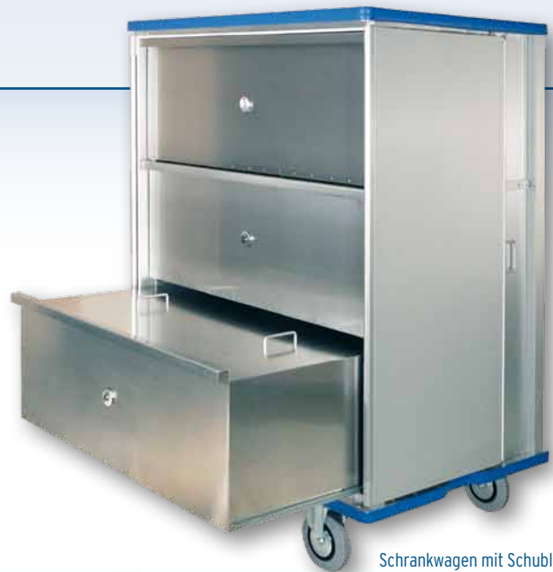
Schrankwagen mit Schubladen auf Teleskop-Auszügen