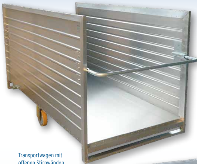
Transportwagen mit offenen Stirnwänden