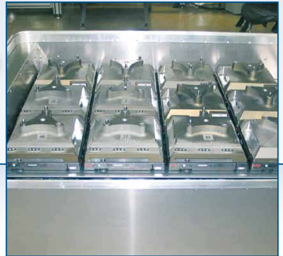
Beladen mit Komponenten für Motorblock