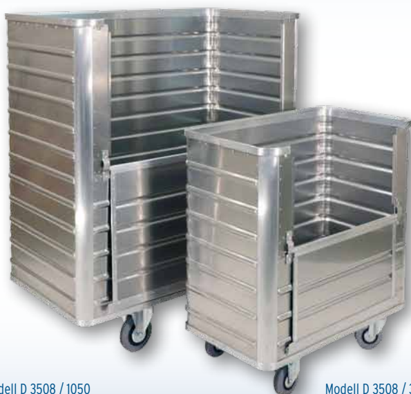
Modell D 3508 / 1050