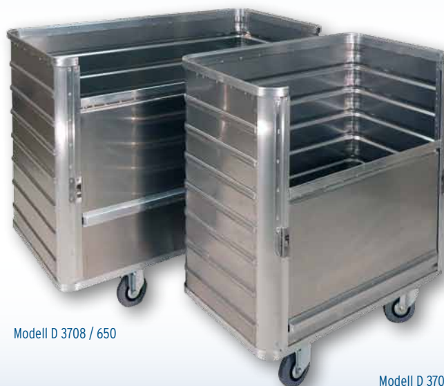
Modell D 3708 / 650