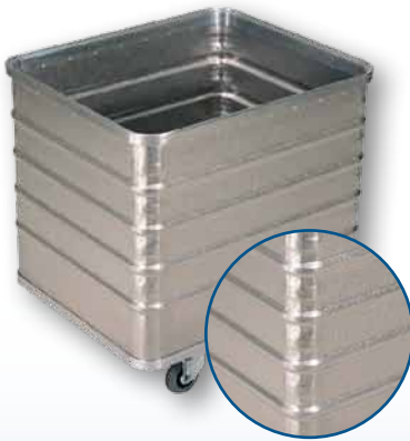
Modell D 3008 / 240