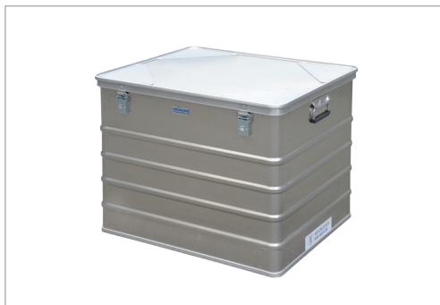
A 1589/239 4B X