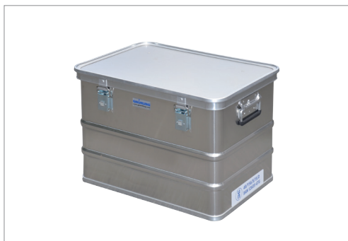
A 1589/73 4B Y

GMÖHLING Gefahrgutverpackungen sind vom Bundesamt für Materialforschung und -prüfung (BAM) in Berlin als Außenverpackung zugelassen: