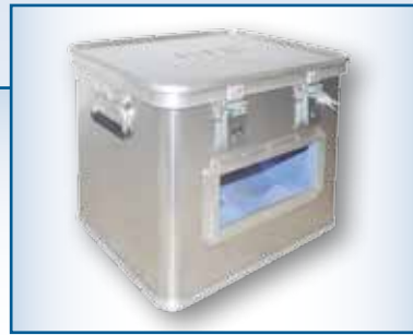
Caisse de transport des supports cylindriques avec regard et système de mousse interne.