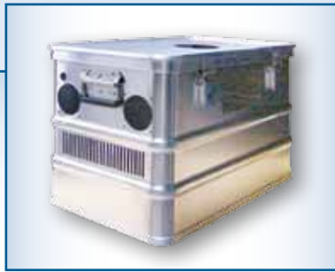
Caisse de transport servant de boîtier pour système d'humidification de l'air.