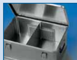
Système de cloisons