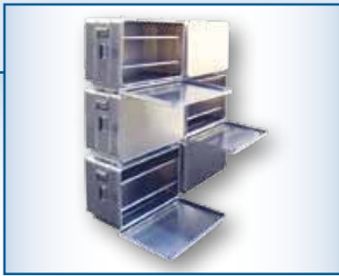
Caisse empilables sur rayon.