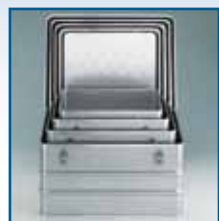
Set A 1599