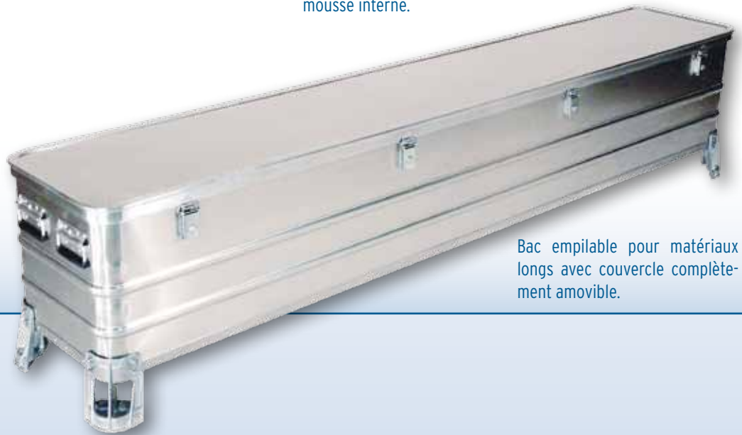
Bac empilable pour matériaux longs avec couvercle complètement amovible.