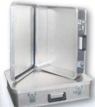
Modèle A 1539 / 36