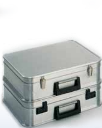
Modèle A 1439 / 19