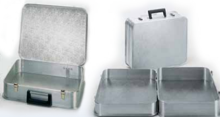
Modèle A 1489 / 24