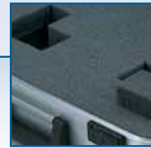
Mousse à plots