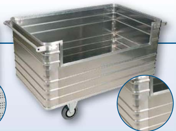
Modèle D 3808 / 945

Modèle: D 3008 / 240 avec surface texturée à propriété anti-rayures