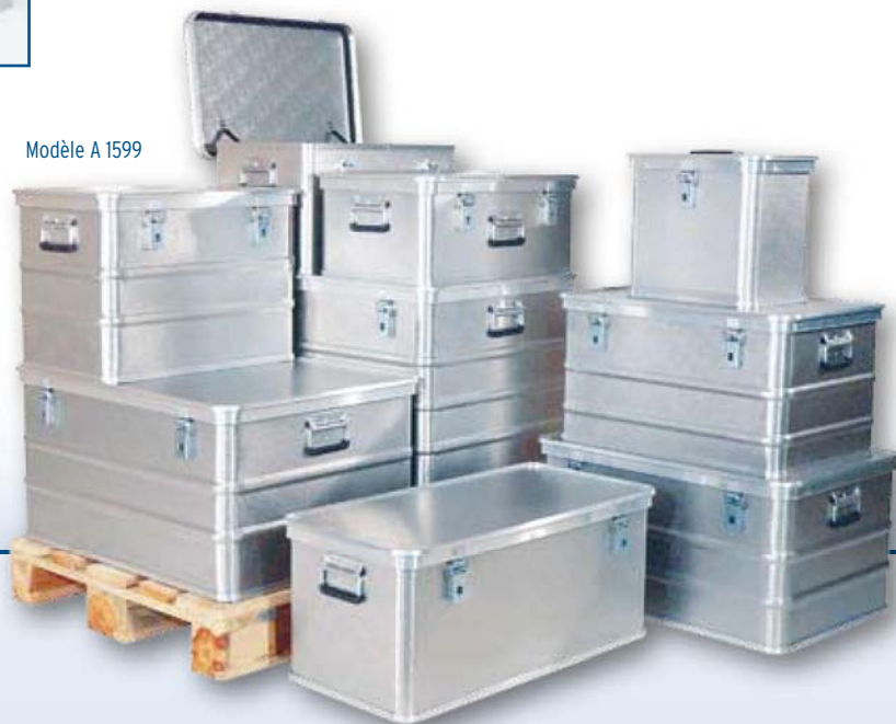
Modèle A 1599