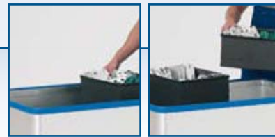
Modèle D 1408 / 350 anodisé

L'utilisation de chariots à fond mobile Gmöhling permet également de ménager le contenu, ce qui représente un énorme avantage lors de la manipulation de biens fragiles et de grande valeur.