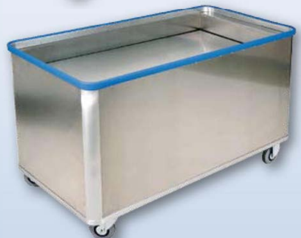
Modèle D 5408 / 580