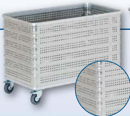
Modèle D 3008 / 430 P