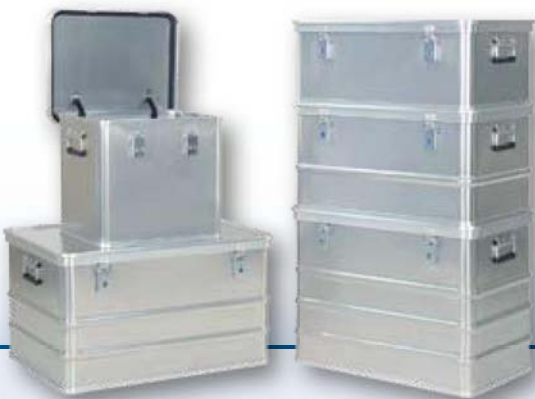
Modèle A 1569

Fabriquées en alliage d'aluminium de haute qualité, les caisses de GMÖHLING sont idéales pour la sécurité de stockage et de transport d'objets de valeur dans tous les domaines. Nous proposons un large assortiment de caisses standards.