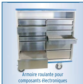
Armoire roulante pour composants électroniques