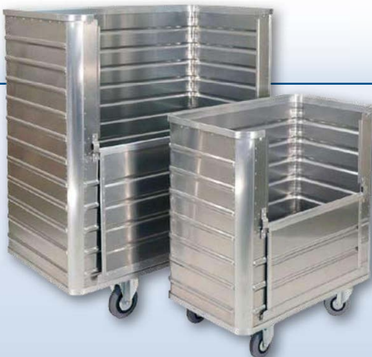
Modèle D 3508 / 1050