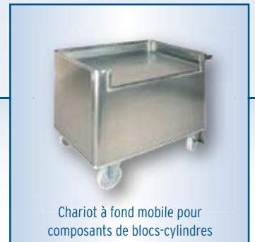
Chariot à fond mobile pour composants de blocs-cylindres