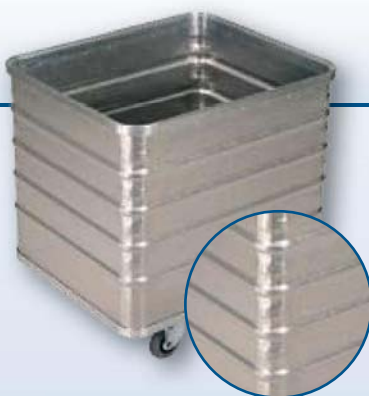
Modèle D 3008 / 240