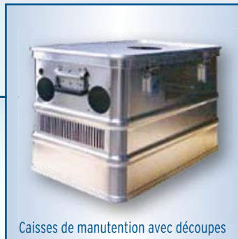
Caisses de manutention avec découpes