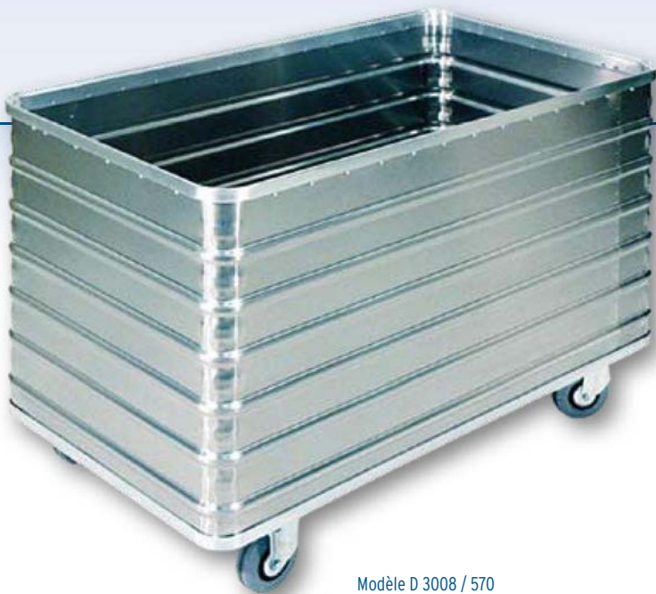
Modèle D 3008 / 570

Les chariots de manutention très pratiques de GMÖHLING sont disponibles en plusieurs versions et même sur mesure. N'hésitez pas à nous contacter, nous serons ravis de vous conseiller!