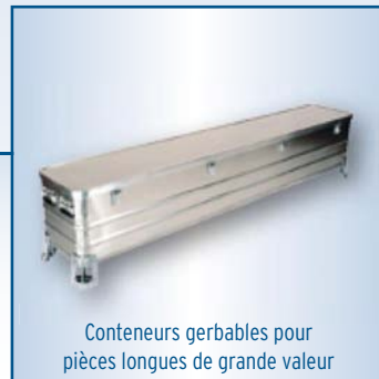
Conteneurs gerbables pour pièces longues de grande valeur