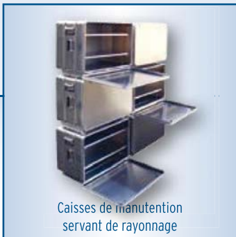
Caisses de manutention servant de rayonnage