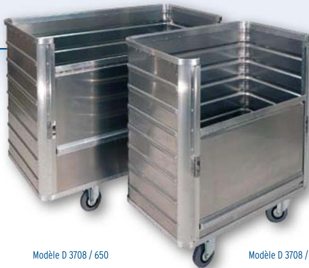
Modèle D 3708 / 650