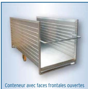
Conteneur avec faces frontales ouvertes