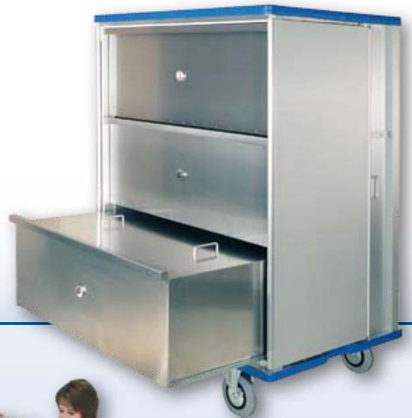
Armoire roulante avec tiroirs sur glissières télescopiques