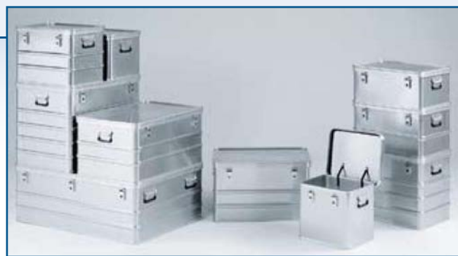
Modèle A 1589