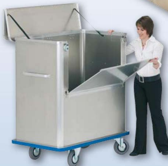
Chariot de manutention avec paroi longitudinale rabattable et couvercle en deux parties

GMÖHLING Transportgeräte GmbH Stadelner Hauptstr. 34 90765 Fürth | Germany Phone: +49 (0) 911 - 7669 - 0 Fax: +49 (0) 911 - 7669 - 277 sales@gmoehling.com www.gmoehling.com