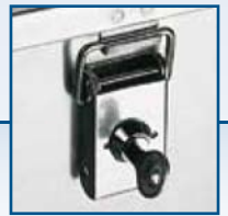
Serrure à cylindre