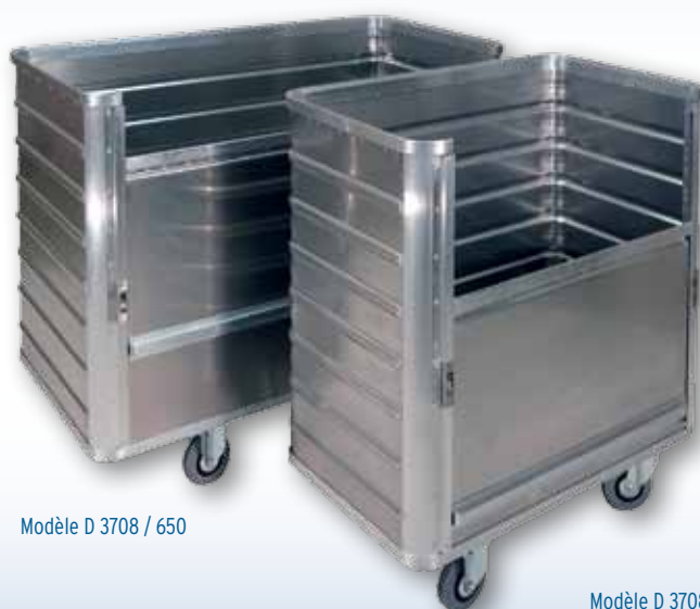
Modèle D 3708 / 650