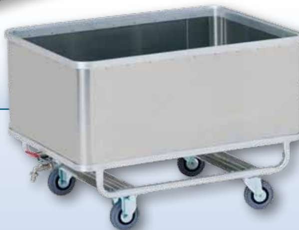
Conteneur étanche avec robinet de purge