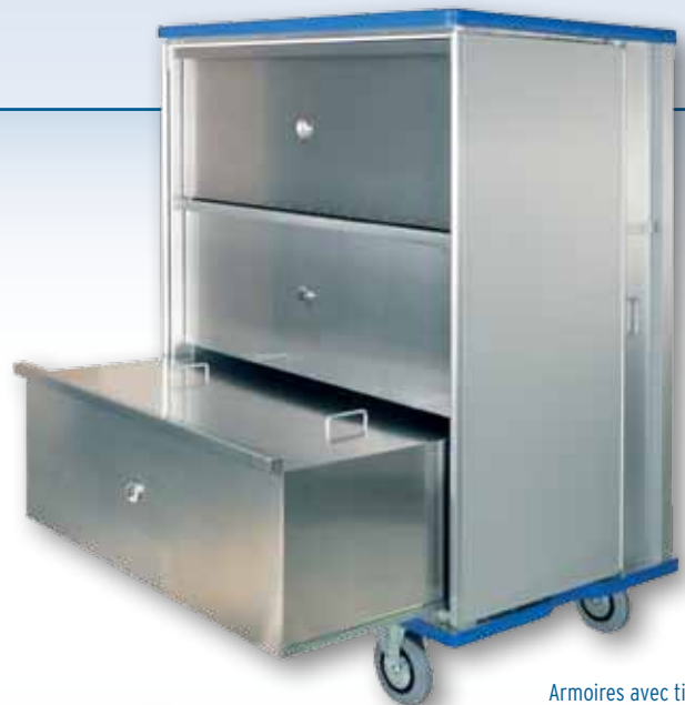
Armoires avec tiroirs télescopiques