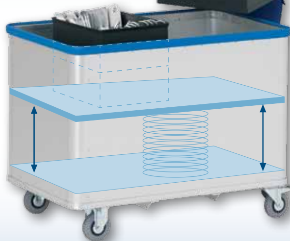
Modèle D 1408 / 350 - anodisé

Le fond flottant dépendant de la charge est guidé sans inclinaison dans des profilés spéciaux de l'avant du chariot. 8 galets montés sur roulement à billes assurent un déplacement parallèle précis du fond flottant. Des parois lisses réduisent le frottement de la charge et favorisent une réaction immédiate du fond flottant aux modifications de charge.