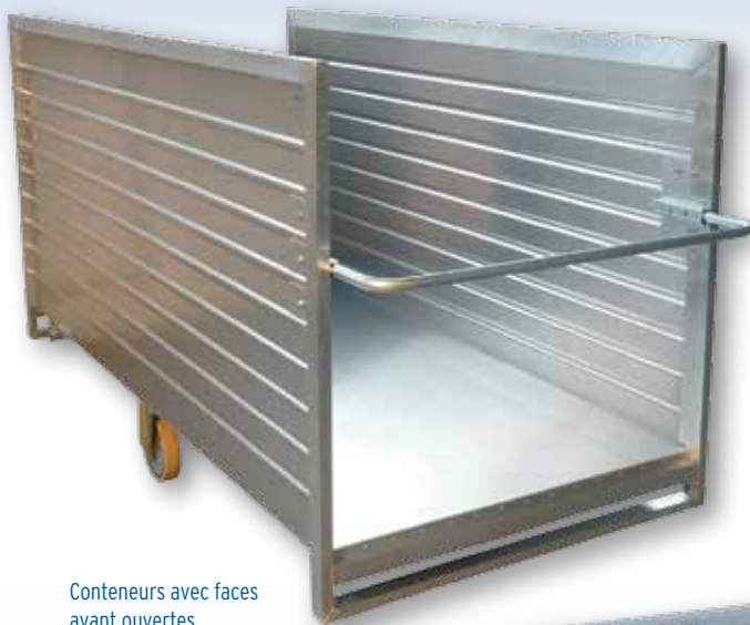
Conteneurs avec faces avant ouvertes